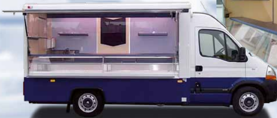
Myyntiauto Renault 3500 E

Lisää myyntiäsi liikkuvalla kalatuotteiden myynnillä toreilla, markkinoilla, myymälöiden ulkopuolella ja "ovelta ovelle".