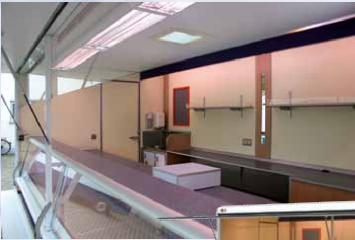
Myyntiauto Renault 4500 E